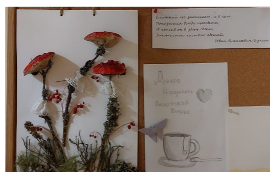
Работы выполнены кадетами 7 «Б» класса.

Главный редактор — Каширская Р. С. Технический редактор — Каширская Р. С. Корректурa — Каширская Р. С.