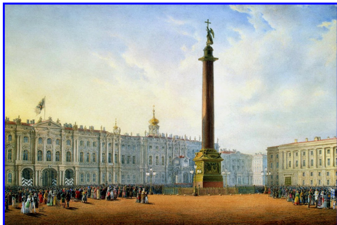
Василий Садовников. Вид Дворцовой площади и Зимнего дворца в Санкт-Петербурге (фрагмент). 1840-е. Государственный Эрмитаж.

► Исаакиевский собор — самый большой собор в России и четвертый по масштабу в мире. На позолоту куполов